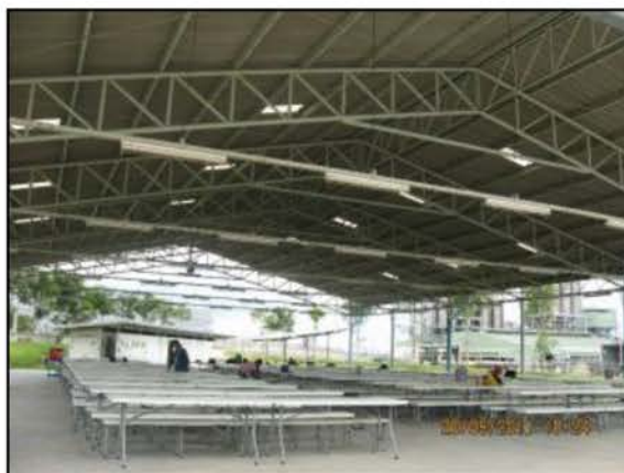
ภาพที่ 2.2-23 อาคารที่พักผู้รับเหมาสำหรับช่วงหยุดซ่อมบำรุง