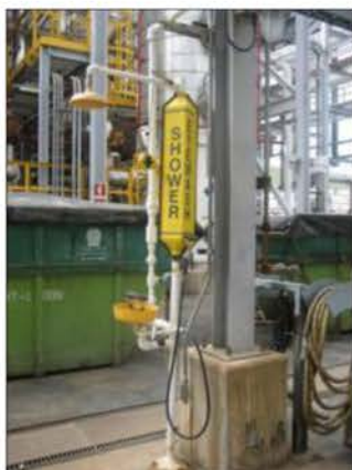
อุปกรณ์ชำระล้างฉุกเฉิน