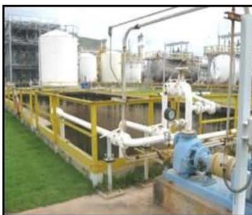
ภาพที่ 2.2-20 ลานถัง และบ่อรองรับสารเคมีหากเกิดการรั่วไหล