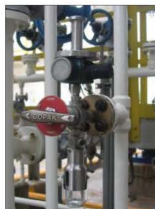
ภาพที่ 2.2-5 อุปกรณ์เก็บตัวอย่างสารไฮโดรคาร์บอน