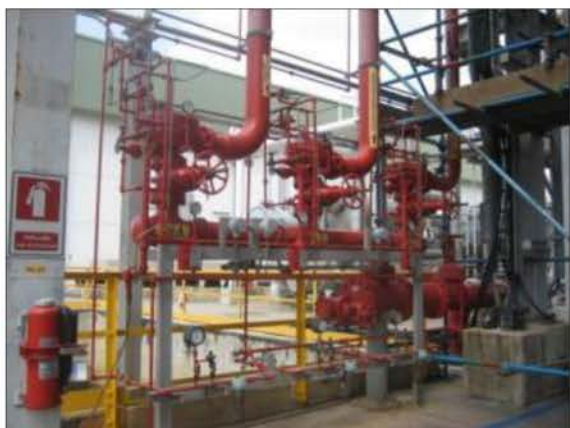
ถังดับเพลิง และระบบดับเพลิงบริเวณเขตการผลิต