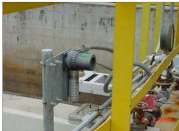
บ่อพักน้ำ ES-1070