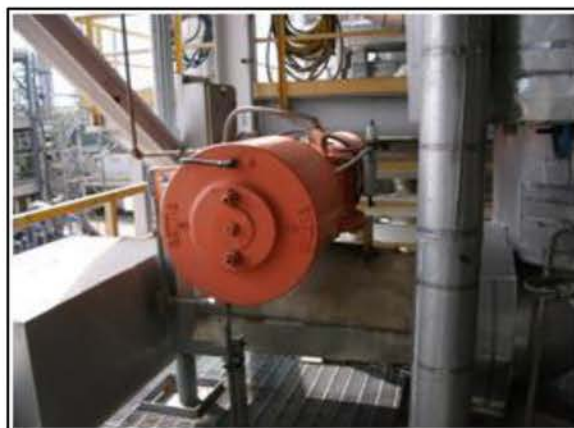
วาล์วปิดระบบอัตโนมัติ