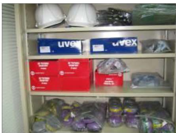
อุปกรณ์ป้องกันอันตรายส่วนบุคคลสำรอง