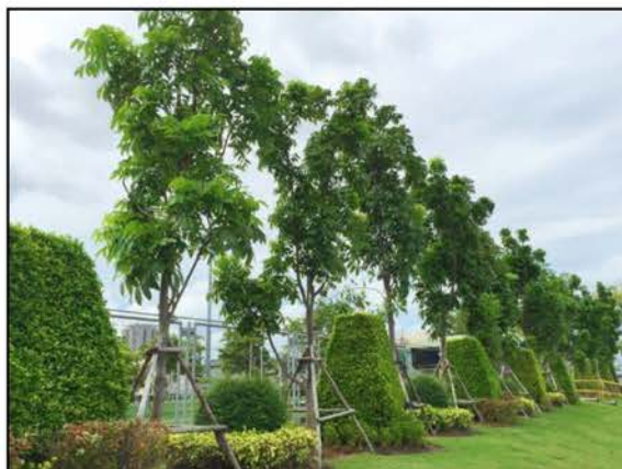
ภาพที่ 2.2-22 (ต่อ) พื้นที่สีเขียวของกลุ่มบริษัทร่วมทุน