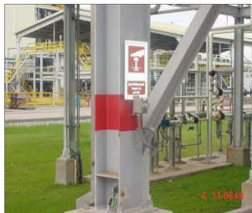
ภาพที่ 2.2-21 ปุ่มกดแจ้งเหตุสัญญาณฉุกเฉิน