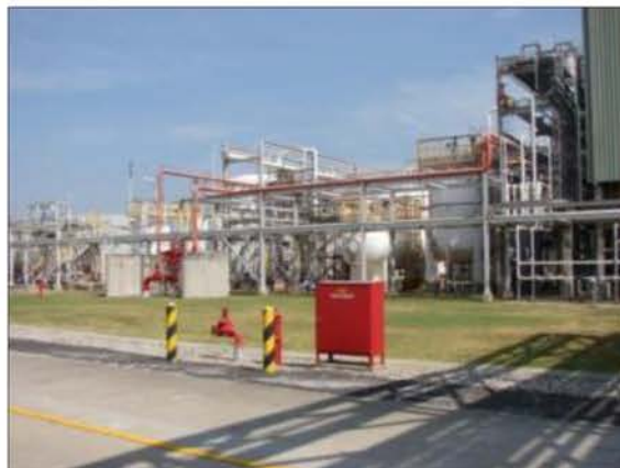
ถังดับเพลิง และระบบดับเพลิงบริเวณเขตการผลิต