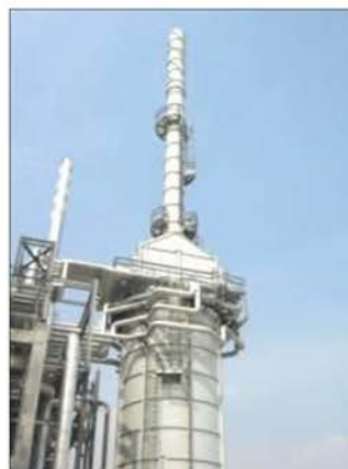
Furnace 2 (F-520)