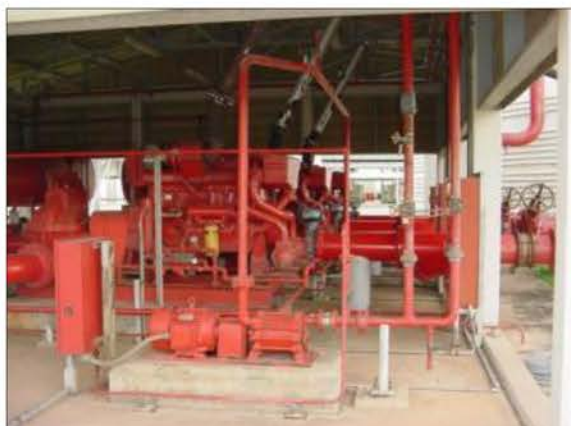
ปั้มน้ำดับเพลิงของโครงการ