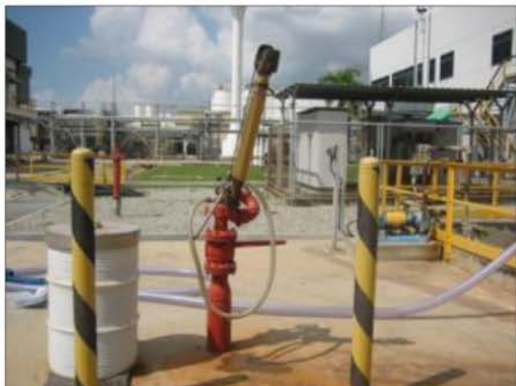
Monitor Gun และถังน้ำยาโฟมดับเพลิง