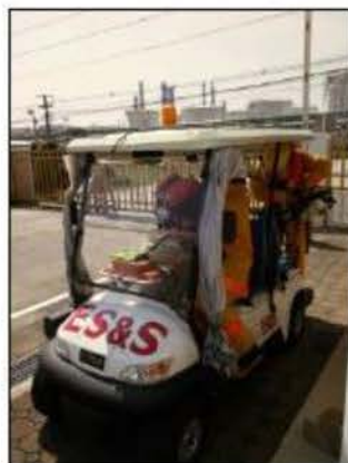
รถยนต์ฉุกเฉินพร้อมอุปกรณ์ในการปฐมพยาบาล และกู้ภัยเบื้องต้น ที่อาคารควบคุมการผลิต