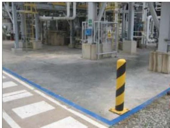
C-111 Ethylene Feed Compressor