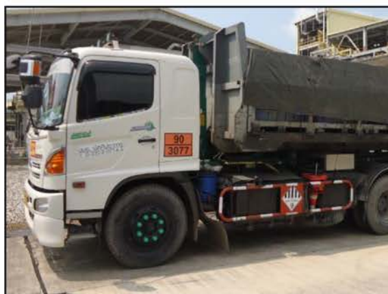
ป้ายชื้อบริษัทขนส่งสารเคมีและของเสีย