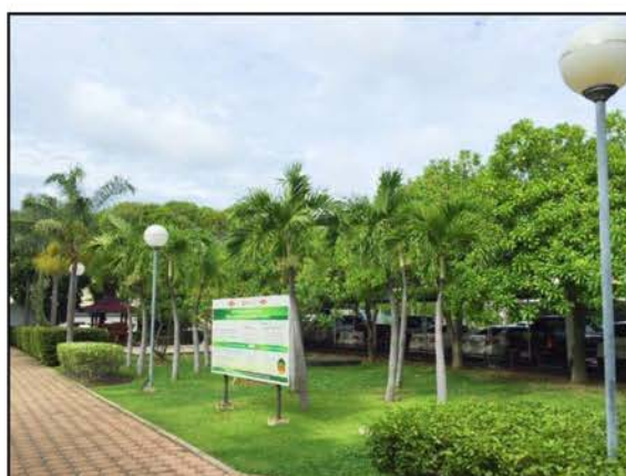
ภาพที่ 2.2-22 พื้นที่สีเขียวของกลุ่มบริษัทร่วมทุน