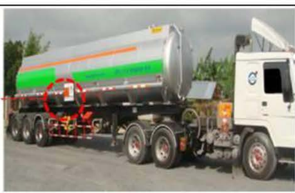
ภาพที่ 2.2-10 การควบคุมการขับช้โดยระบบ GPS และป้ายชื้อบริษัทขนส่งสารเคมีและของเสีย