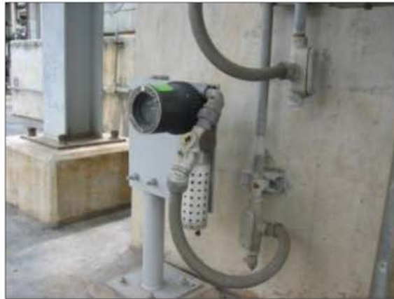
อุปกรณ์ตรวจสอบการรั่วไหลของก๊าซ (Gas Detector)