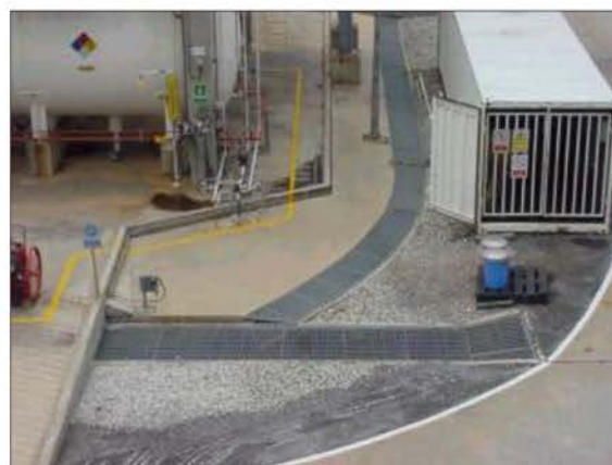
วางระบายน้ำฝน