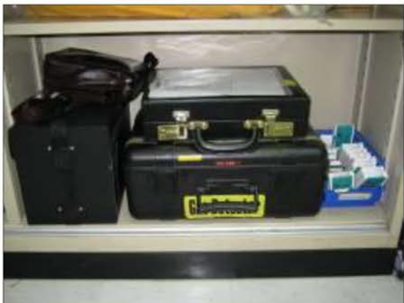
เครื่องมือตรวจวัดสารเคมีในบรรยากาศชนิดพกพา