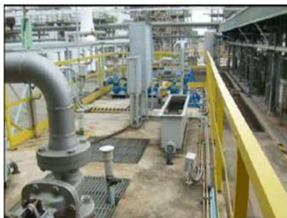
ภาพที่ 2.2-9 ระบบบำบัดน้ำเสียส่วนกลางของกลุ่มบริษัทร่วมทุนฯ