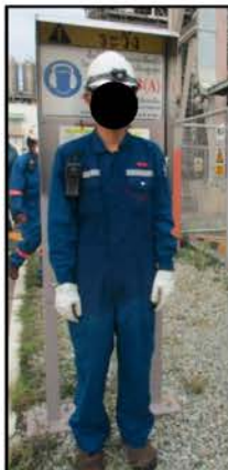
ภาพที่ 2.2-7 พนักงานสวมใส่อุปกรณ์ป้องกันอันตรายส่วนบุคคล