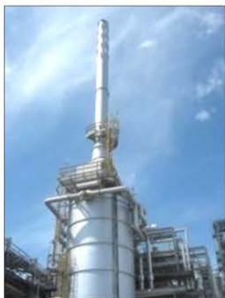
Furnace 1 (F-510)