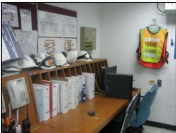
หน่วยงานระงับเหตุฉุกเฉิน