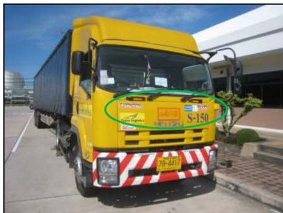
การควบคุมการขับช้โดยระบบ GPS