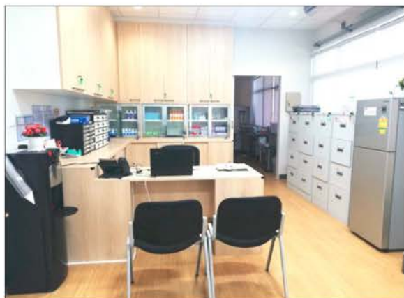
ภาพที่ 2.2-17 (ต่อ) อุปกรณ์ป้องกันอันตรายกรณีฉุกเฉิน ชุดปฐมพยาบาล รถฉุกเฉิน และหน่วยงานรับเหตุฉุกเฉิน