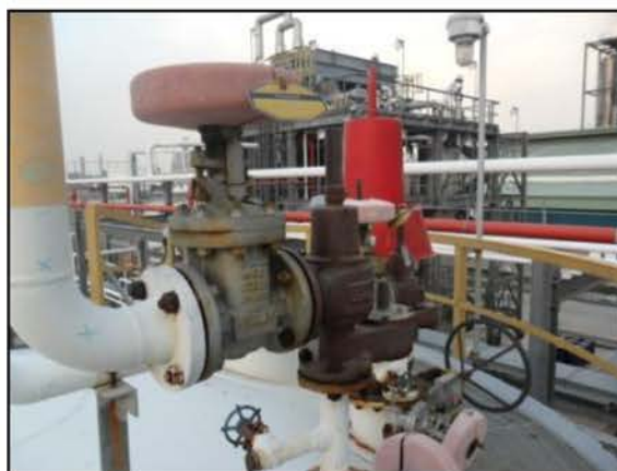
Pressure Vacuum Relief Valve