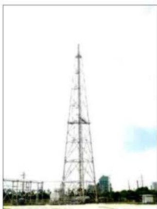
ภาพที่ 2.2-3 ปล่องระบาย Furnace ของสายการผลิตที่ 1 และสายการผลิตที่ 2