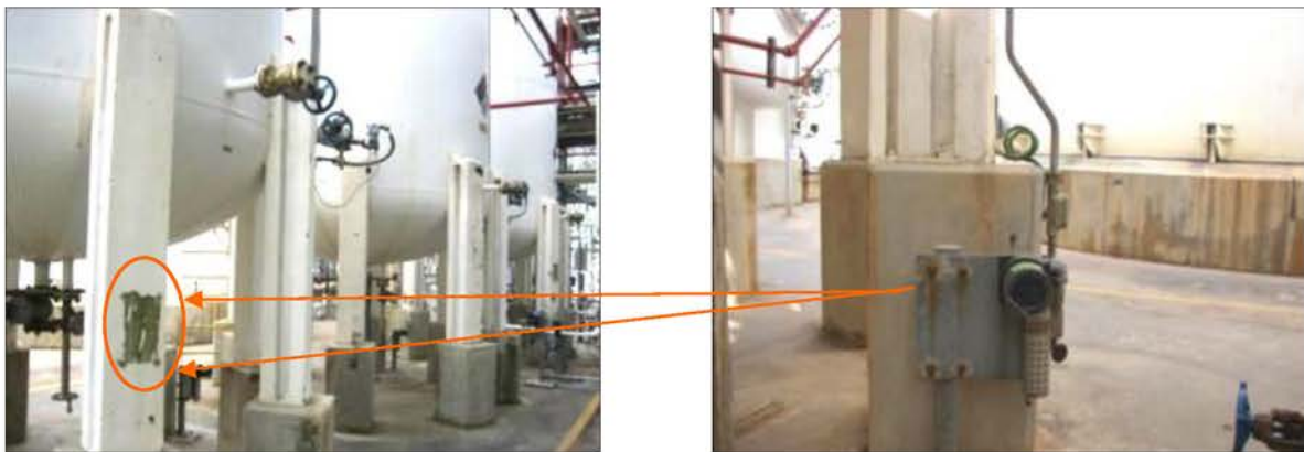
Gas Detector บริเวณที่เก็บสารเคมี