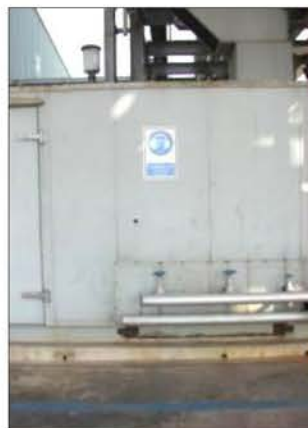
C-901,901,903 Air Compressor

ภาพที่ 2.2-6 ป้ายเตือนและบริเวณเส้นสีน้ำเงินให้พนักงานสวมอุปกรณ์ป้องกันเสี่ยงในบริเวณที่มีเสียงดัง