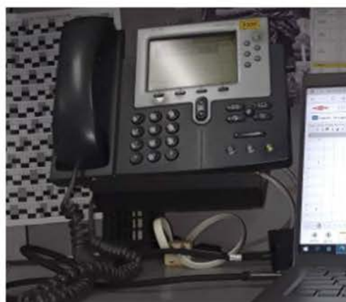
โทรศัพท์แจ้งเหตุฉุกเฉิน