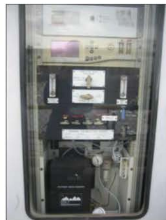
ภาพที่ 2.2-2 ระบบ CEMs ของโครงการ