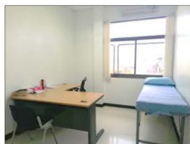
ภาพที่ 2.2-18 ห้องปฐมพยาบาล (First Aid Room)