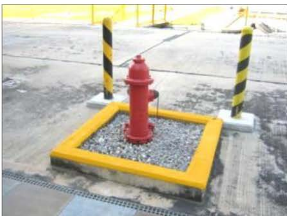
หัวจ่ายน้ำดับเพลิง