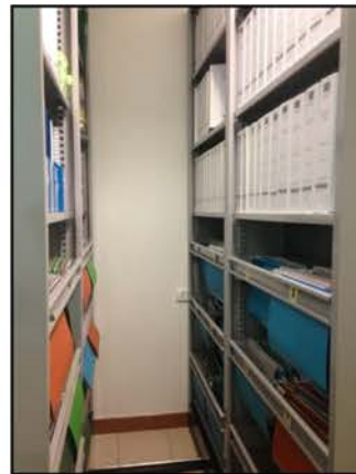
ภาพที่ 2.2-1 การจัดเก็บบันทึกผลการตรวจสอบสุขภาพของพนักงาน