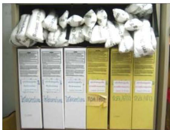
เรซินดูดซับสารเคมี (ไฮโดรคาร์บอน/กรด-ต่าง)