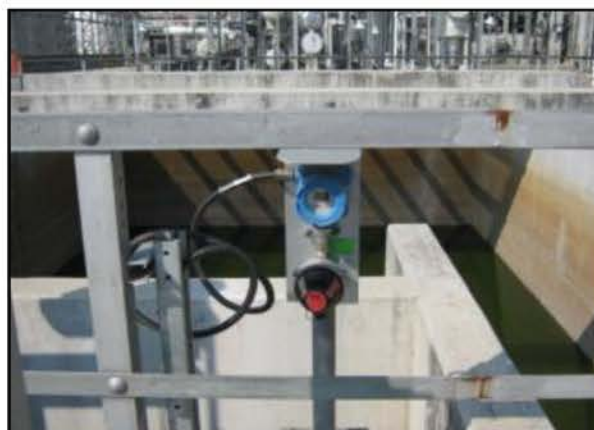
บ่อพักน้ำ ES-2060

ภาพที่ 2.2-8 (ต่อ) บ่อพักน้ำ (Sump) ของโครงการ และเครื่องมือตรวจวัดสารไฮโดรคาร์บอนบริเวณบ่อพักน้ำ