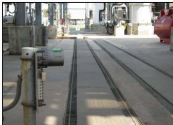
บ่อพักน้ำ H-304