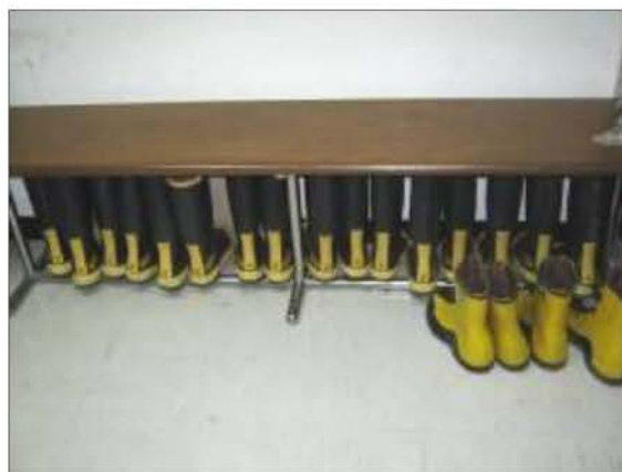
ชุดผจญเพลิง