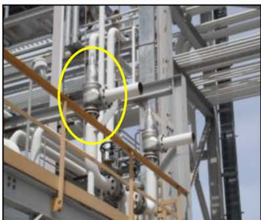
Pressure Safety Valve