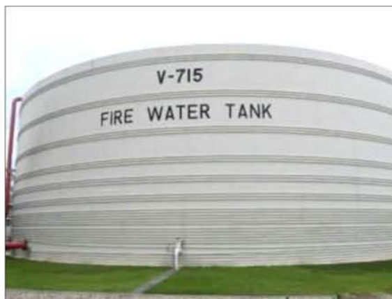
ถังน้ำดับเพลิง