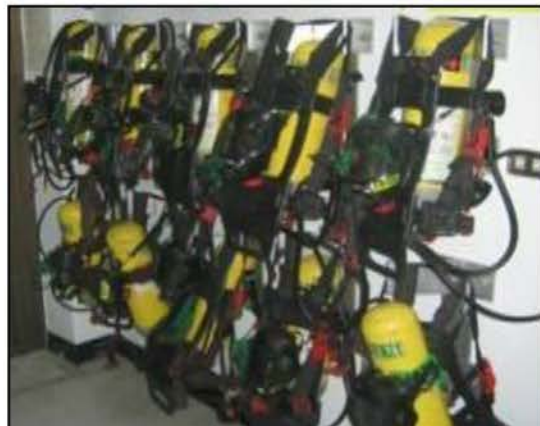
Self Contained Breathing Apparatus