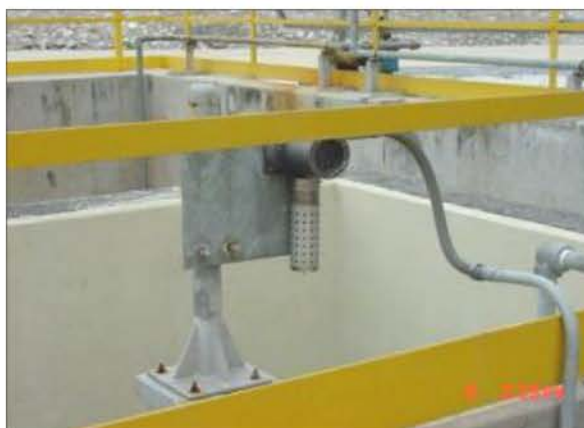
บ่อพักน้ำ ES-1072

ภาพที่ 2.2-8 บ่อพักน้ำ (Sump) ของโครงการ และเครื่องมือตรวจสอบสารไฮโดรคาร์บอนบริเวณบ่อพักน้ำ