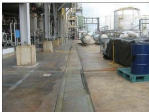
วางระบายน้ำเสีย