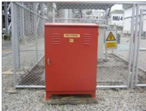
ตู้เก็บสายน้ำดับเพลิง