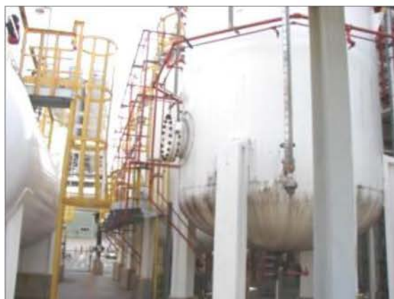
ระบบดับเพลิง Deluge System ในพื้นที่เก็บสารเคมี