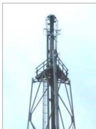
ภาพที่ 2.2-4 ระบบ Flare ของโครงการ