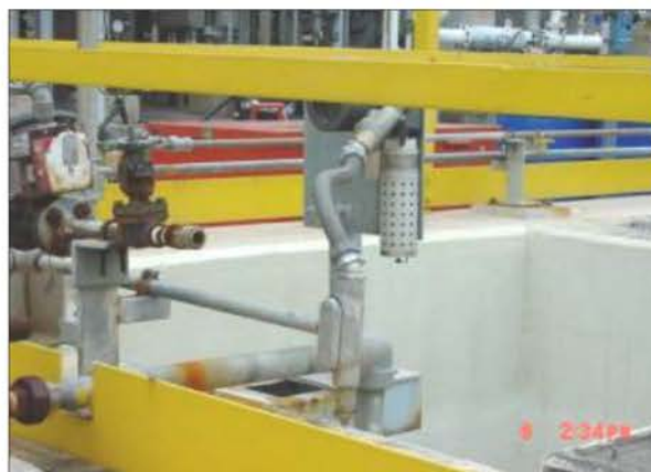
บ่อพักน้ำ ES-1071